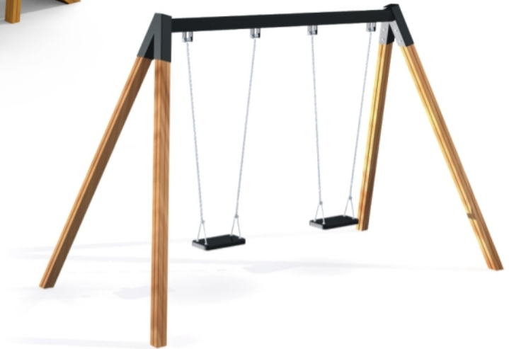
11121 Doppelt Schaukel mit Zwei Sitze