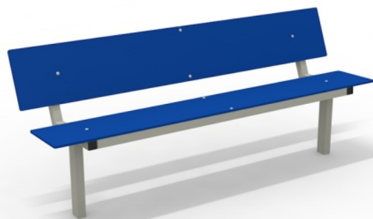
14453 HPL Bank