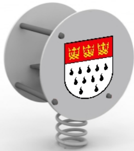
20009 Kreis Wippen