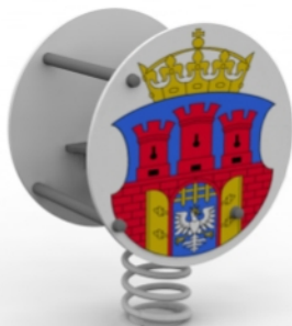
2009 Kreis Wippe